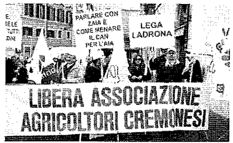
Quote latte: il sit-in della Libera a Montecitorio